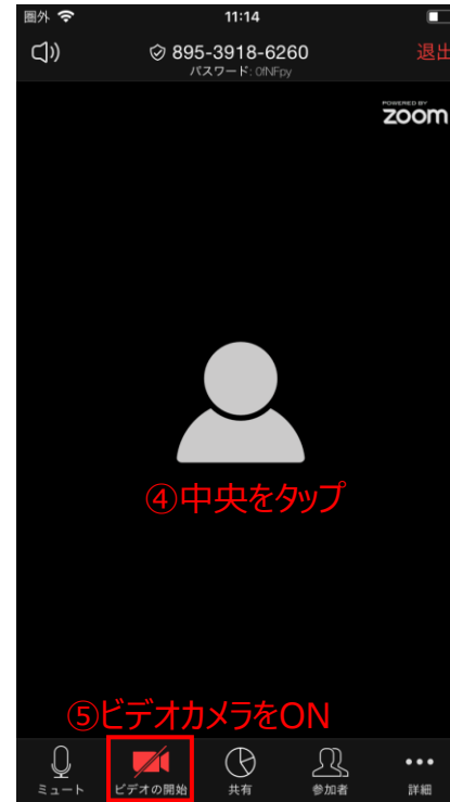
④画面の中央をタップするとフッターが表示され、⑤ビデオカメラをONにする