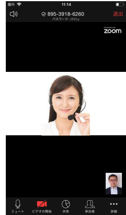
⑥担当の栄養士と面談を実施する