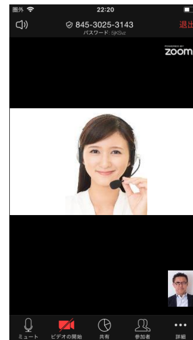
⑥担当の栄養士と面談を実施する