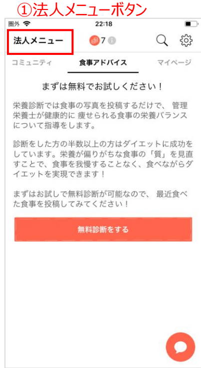
①法人メニューボタンをタップ