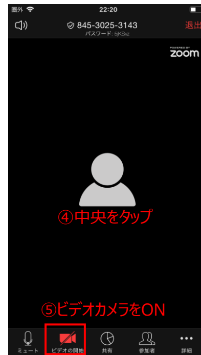
④画面の中央をタップするとフッターが表示され、⑤ビデオカメラをONにする