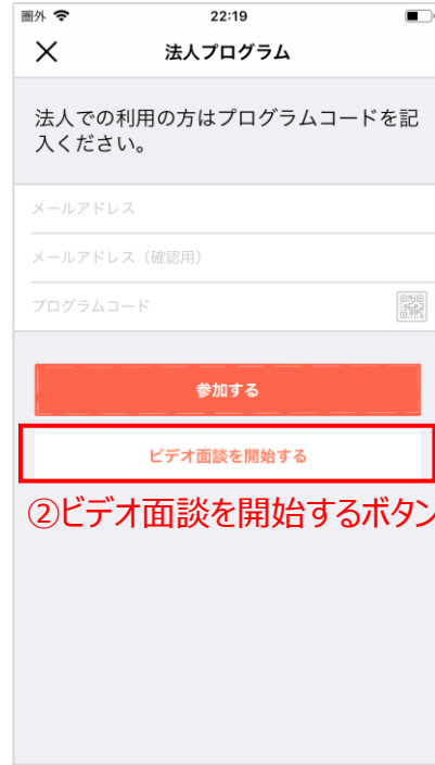
②ビデオ面談を開始するボタンをタップ