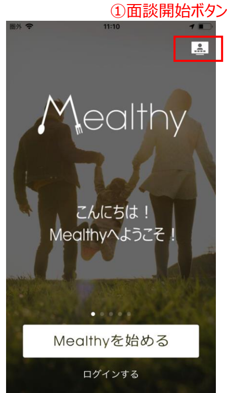
①ログイン画面右上の面談開始ボタンをタップ