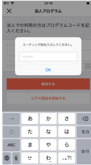
③ミーティングIDを入力