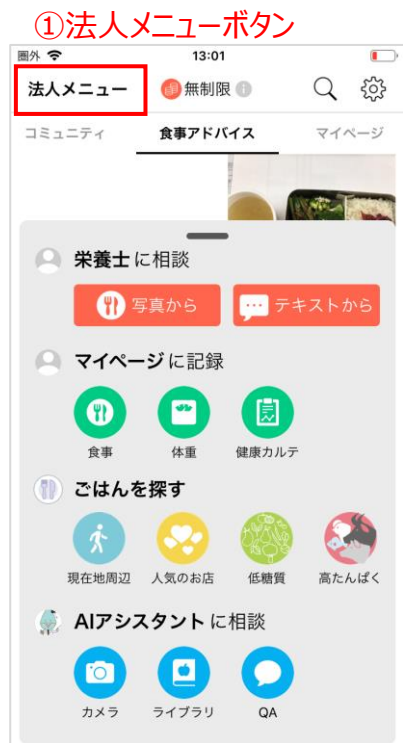
①法人メニューボタンをタップ