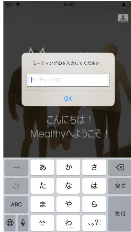
②ミーティングIDを入力