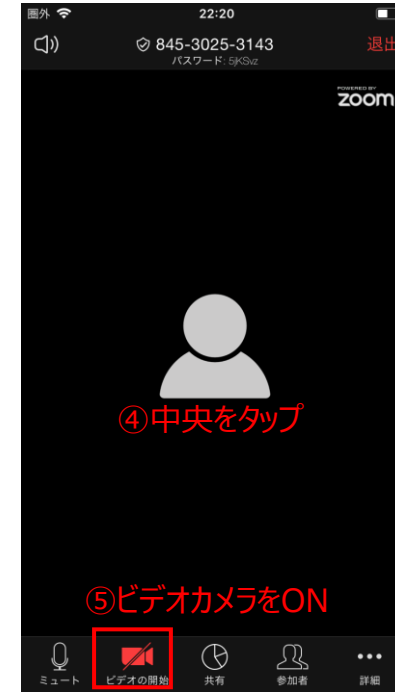
④画面の中央をタップするとフッターが表示され、⑤ビデオカメラをONにする