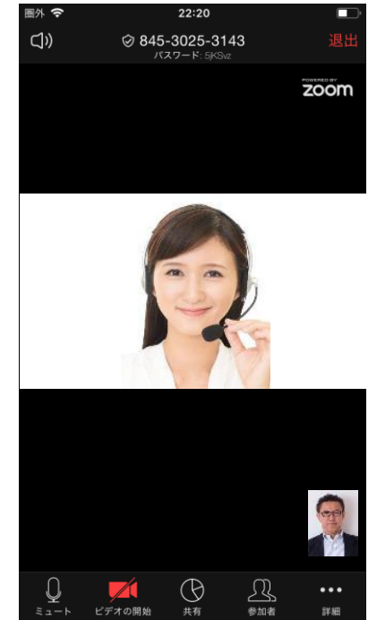
⑥担当の栄養士と面談を実施する